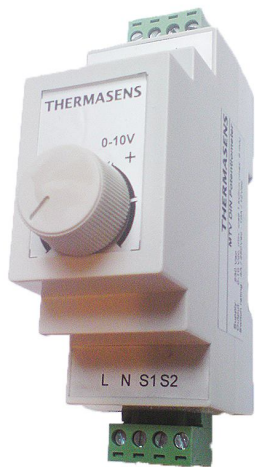
Потенциометр для внешнего задания (0-10)В