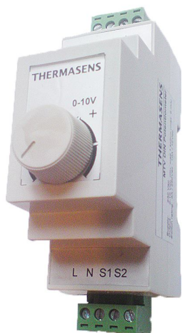
Потенциометр для внешнего задания (0-10)В